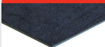
Duralay Multi-fit 1,5 mm