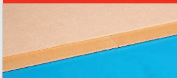
Floorfixx regular 9 mm