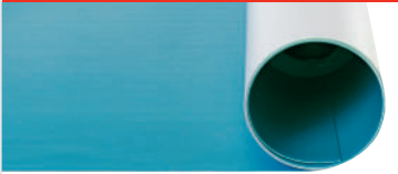
Soundstop LVT 1,0 mm